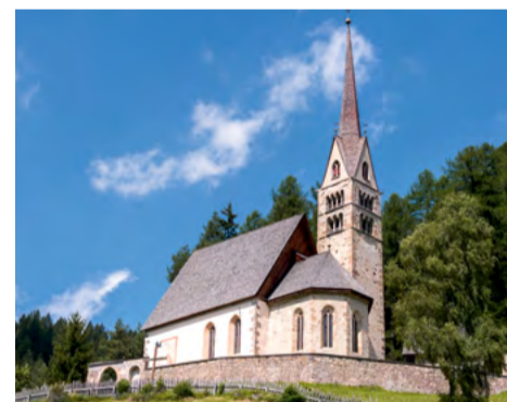
Chiesa di Santa Giuliana / Church of Santa Giuliana / Kirche von Santa Giuliana