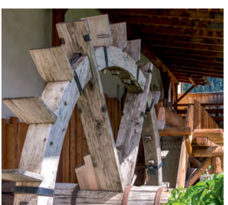
L Molin de Pezot