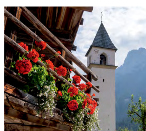
Chiesetta della Madonna Immacolata / Church of the Immaculate Conception / Kapelle der Unbefleckten Jungfrau Maria