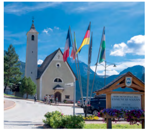
Chiesa della Madonna del Carmelo / Church of Madonna del Carmelo / Kirche von Maria vom Berge Karmel