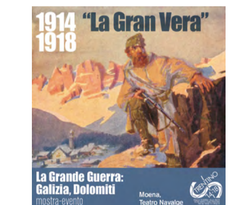
Mostra "1914-1918 La Gran Vera" / Exhibition "1914-1918 La Gran Vera" / Ausstellung "1914-1918 La Gran Vera"