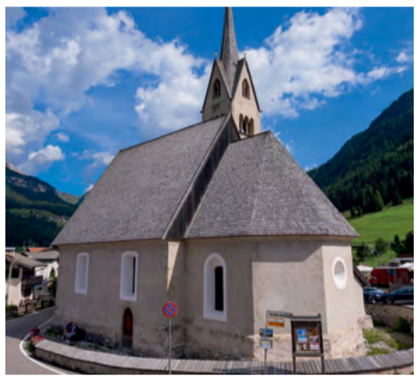
Chiesa di San Nicolò / Church of San Nicolò / Kirche von St. Nikolaus