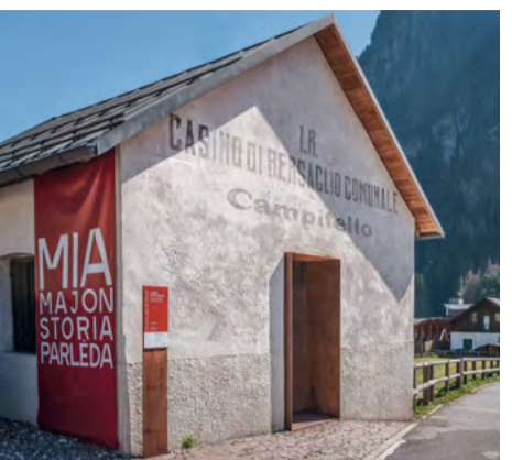
L S'tont - Il casino di bersaglio / L S'tont - the shooting target / L S'tont - Schießstand