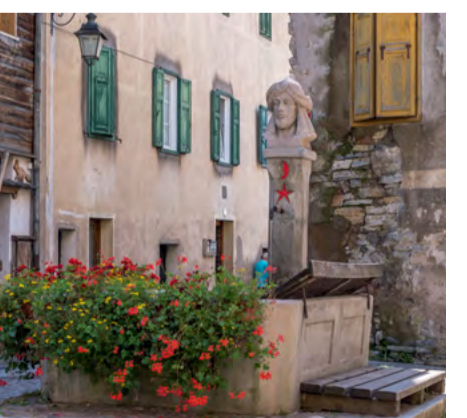
Fontana del turco / The Turkish fountain / Türkenbrunnen