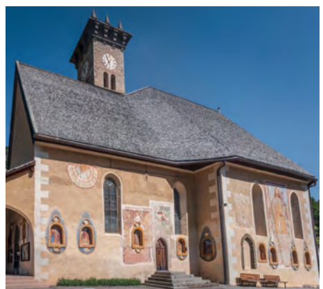
Chiesa dei Santi Filippo e Giacomo / Church of the Saints Filippo and Giacomo / Kirche der Heiligen Filippo und Giacomo