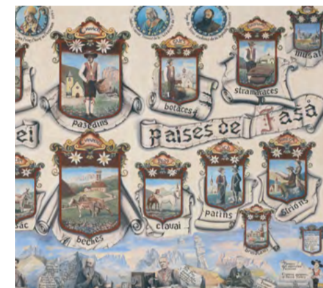
Affreschi di Cesa Bernard / Frescoes in Cesa Bernard / Fresken am Haus Cesa Bernard