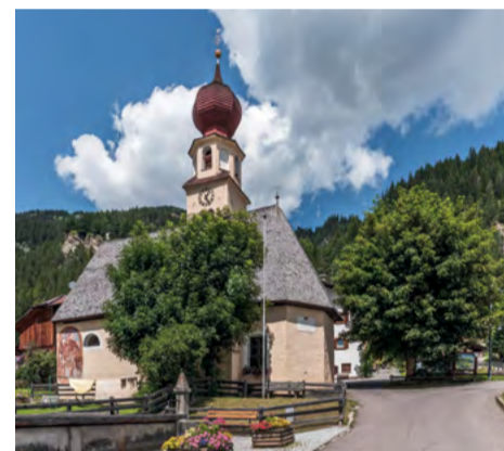
Chiesa della Madonna delle Neve / Church of Madonna della Neve / Kirche von Maria Schnee