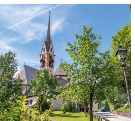
Chiesa di San Vigilio / Church of San Vigilio / Kirche von St. Vigilius