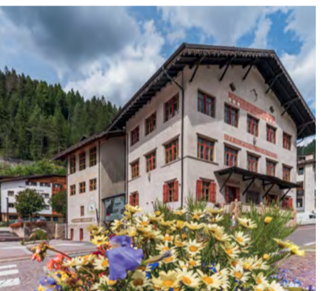
Municipio di Canazei / Canazei Town Hall / Rathaus von Canazei