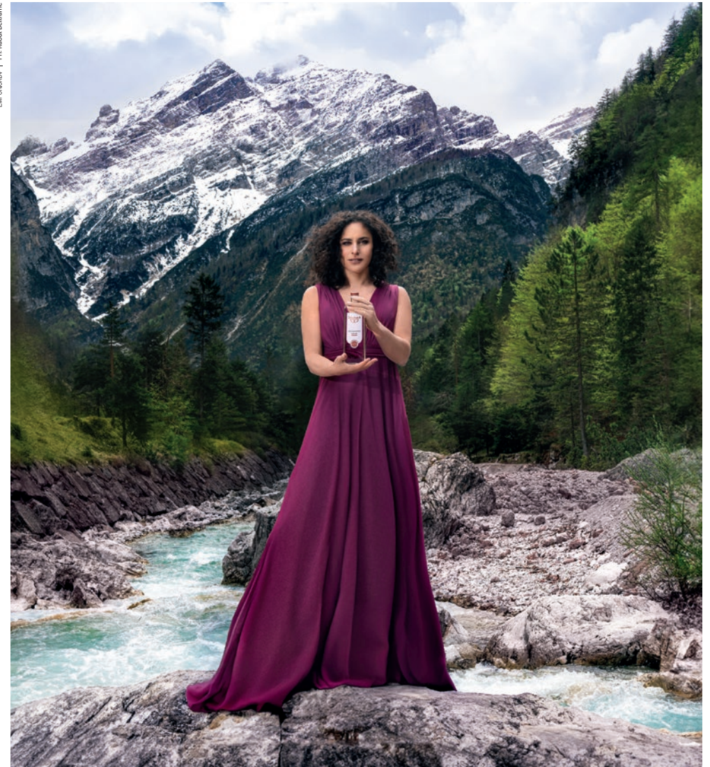
Federica Brignone Ambassador Acqua Dolomia